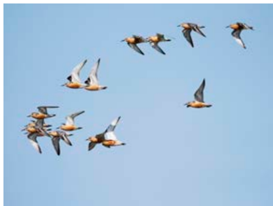
Trækkende Islandske Ryler, Blåvandshuk, 28. juli 2023.

Generelt er det totaler som ligger klart over middel for lokaliteten.