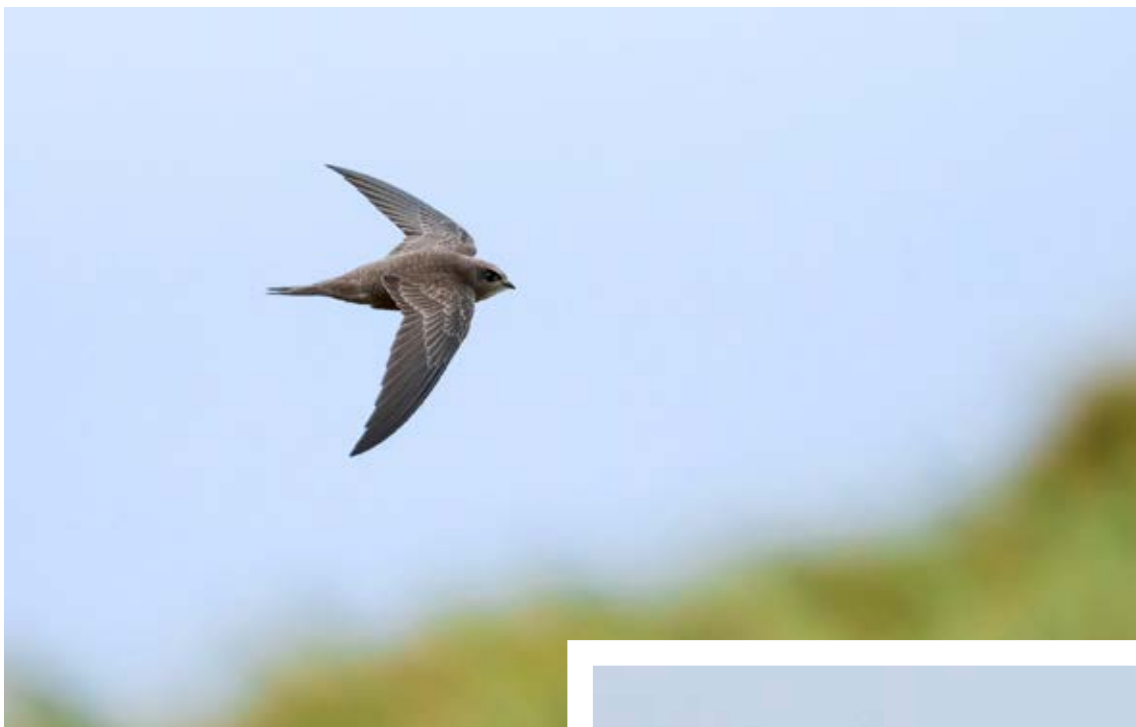
Gråsejler, Blåvandshuk, 5. november 2023.