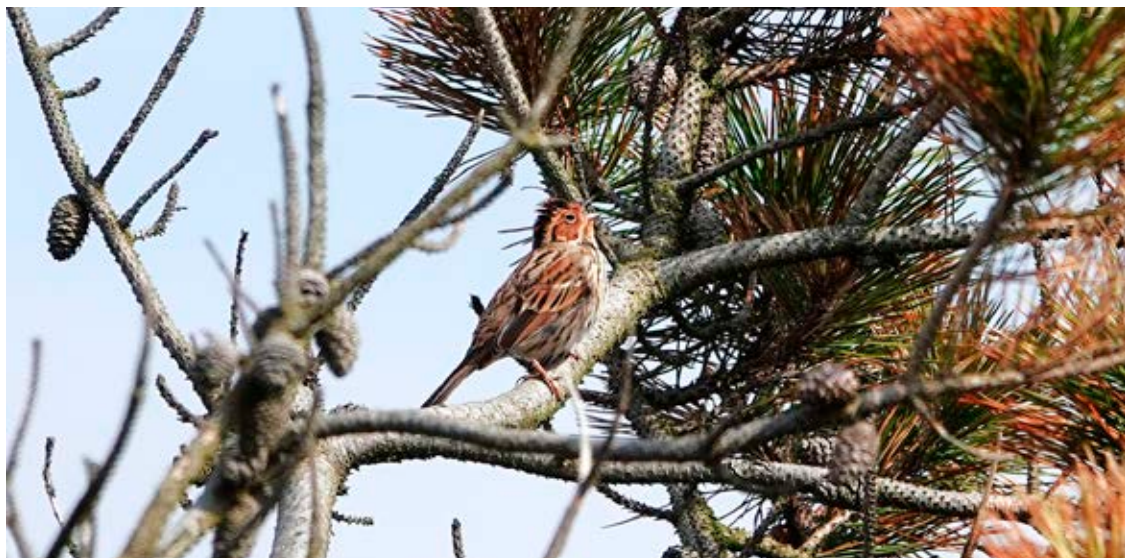
Dvärgværling, Blåvandshuk, 23. april 2023.

Strandskade, som havde en god sæson med 16.880 individer. Det er en af de bedste sæsoner for den art siden 2010.