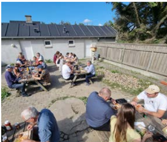
Fællesspisning ved Blåvand Fuglestations 60 års jubilæum, 5. august 2023.

Fuglemæssigt var 2023 omkring middel, med pæne træktaal og enkelte fund af sjældne fugle. Det mest bemærkelsesværdige er nok det stigende antal dværgmåger, der trækker forbi Hukket. I 2023 var totalen på over 10.000 fugle.