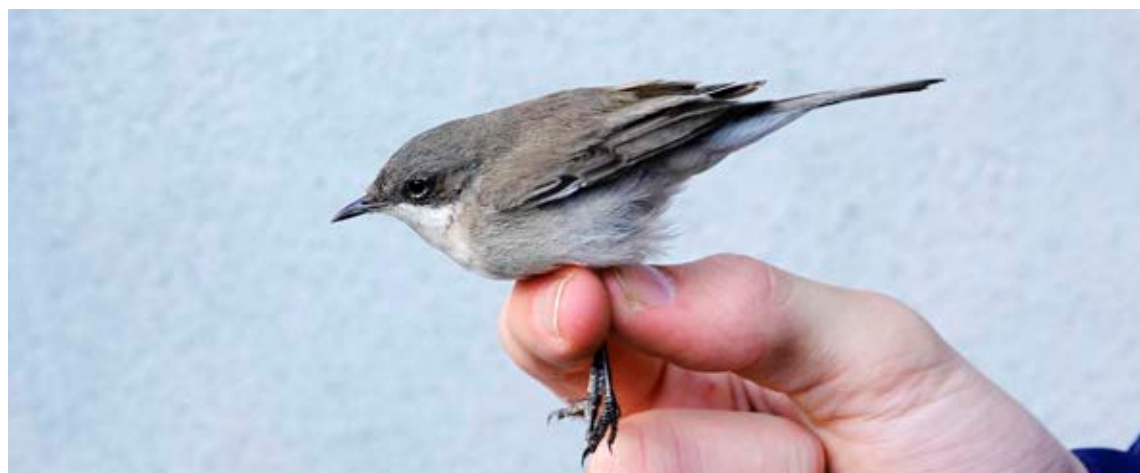
Sibirisk Gærdesanger, Blåvand, 13. november 2023.