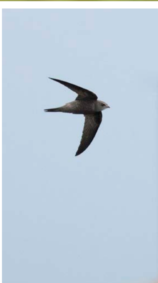
Gråsejler, Blåvandshuk, 5. november 2023.

Efteråret resulterede også i en god total. I alt blev der ringmærket 3.755 fugle fra juli til november med 256 i juli, 730 i august, 697 i september, 1.572 i oktober og 500 i november. Det er et resultat omkring gennemsnittet, på