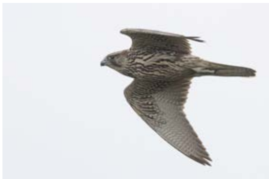
Jagtfalk, Blåvandshuk, 2. oktober 2023.

Dværgmåge havde igen et fantastisk godt efterår med en total på 10.342 individer. Endnu engang en sæsonrekord for denne art i Blåvand! Trækket forekommer hovedsageligt i slutningen af oktober og starten af november. Specielt opleves trækket kraftigst, når vinden er i vestlige retning-er. Mange af fuglene følger kysten, og observatørerne får