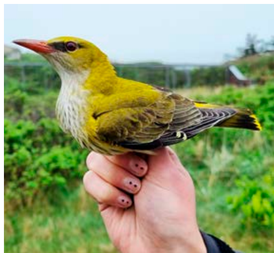
Fuglestationens første ringmærkede Pirol, 11.maj 2023.

2022 var ret sløv på raritetsfronten, og det samme blev 2023. Det eneste SU-fund i nettene blev en Sibirisk Gærdesanger (ssp. blythii), der blev fanget den 13. november. Fjer fra fuglen blev sendt til DNA-analyse og kom tilbage som bekræftet blythii og blev dermed Danmarks 5. sikre fund af denne østlige underart af Gærdesanger. Derudover blev der fanget en Høgesanger, to individer af Lille Fluesnapper og to Dværgværlinger. De to Dværgværlinger blev fanget under efterårets lokale tilstrømning af arten. I efteråret 2023 blev der også prøvet kræfter med natfangst, og det resulterede i spændende vadefuglefangster af bl.a. Dværgryle, Enkeltbekkasin, Lille Kobbersnepe og Sortgrå Ryle.