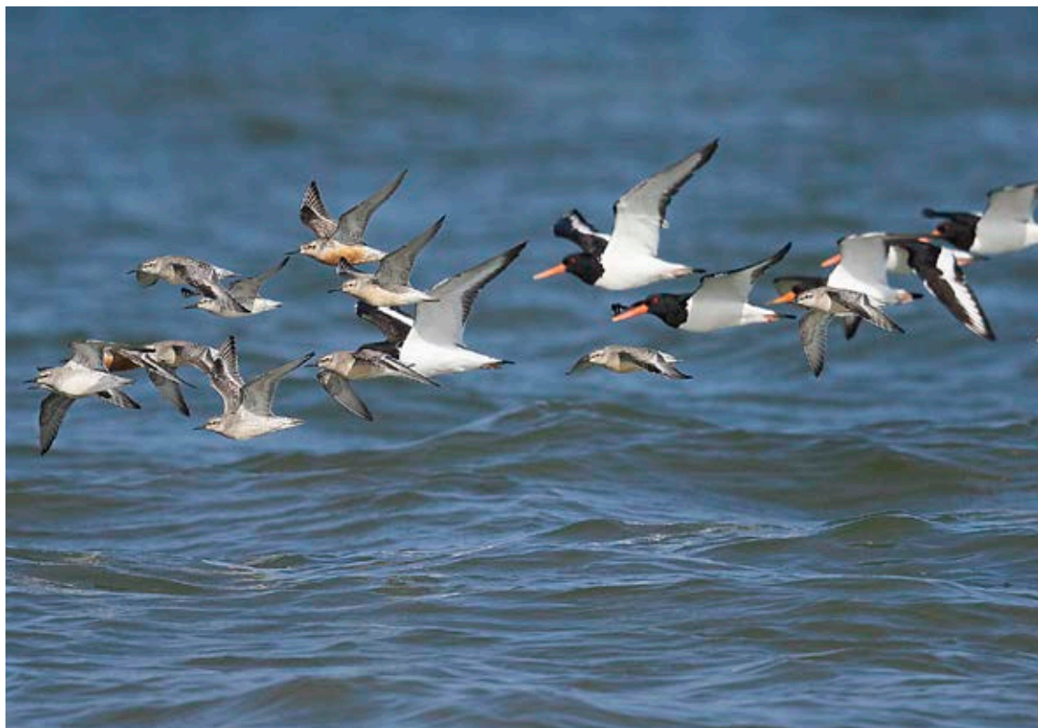
Trækkende Strandkader og Islandske Ryler, Blåvandshuk, 20. august 2023.