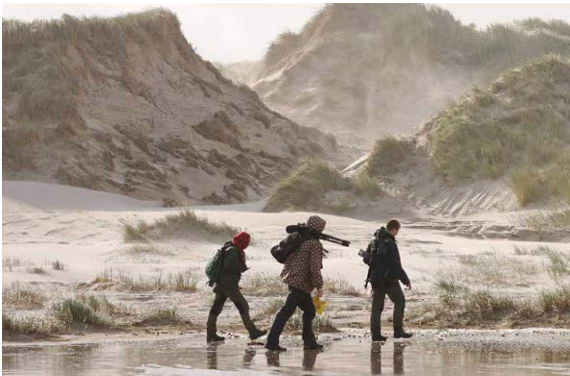
Hjemtur fra Sabinebunkeren, 9. august 2023.

Af andre sjældenheder skal nævnes en trækkende Gråsejler som sås 4/11. Igen et rigtig godt fund, og i en periode